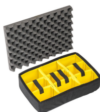
1505 Cloison en mousse