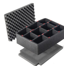
1500TPKIT Kit de séparation de la valise TrekPak