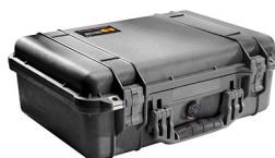
1500NF No Foam