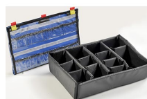
1505EMS Trousse d'accessoires EMS (classer pour couvercle et jeu de séparateurs)