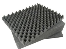
1501 Jeu de mousses de rechange, 3 pièces