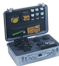
1508 Pochette couvercle photographe