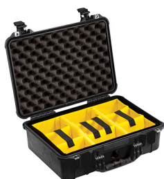
1504 With Padded Dividers