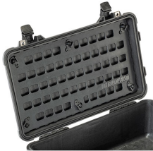
1510MP EZ-Click™ MOLLE Panel