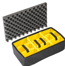
1515 Cloison en mousse