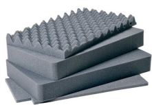
1511 Jeu de mousses de rechange, 4 pièces