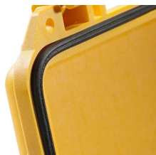
1513 Joint torique de remplacement