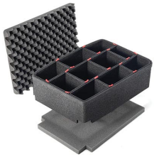
1510TPKIT Kit de séparation de la valise TrekPak