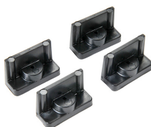
1507 Supports rapides - jeu de 4