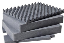
1561 Jeu de mousses de rechange, 4 pièces