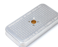
1500D Gel de silice dessicant