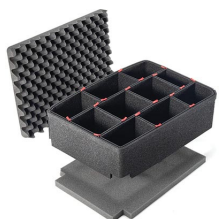
1560TPKIT Kit de séparation de la valise TrekPak