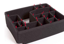
1560EUTP Kit de séparation de la valise TrekPak