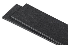
1560TPDIV Séparateurs TrekPak supplémentaires